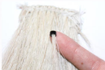
Microring sitzt auf der Strähne