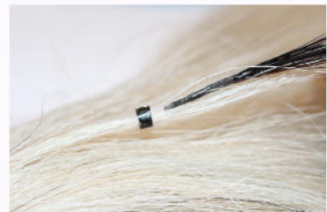
Extension kann wieder entfernt werden

Hinweis: Mähnenspray nur unterhalb des Microrings auftragen. Für einen besseren Halt zwei Microrings pro Extensions oder Pullmann Glue verwenden