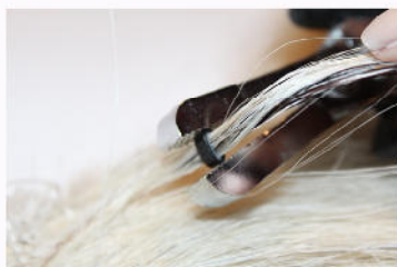
Zum lösen den Microring wieder zurück drücken