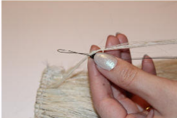
Microring über Strähne ziehen