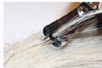
Microring ist wieder in seiner ursprünglichen Form