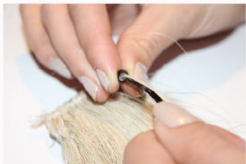
Extension in den Microring einstecken