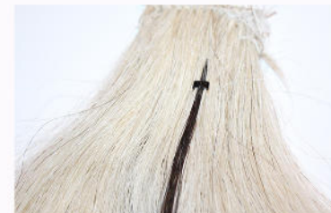
Extension sind nun fest mit Eigenhaar verbunden