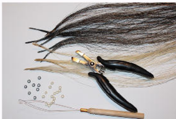
Equipment: Microrings, Zange, Einfädler & Extensions