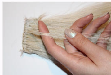
Strähne abteilen (gleiche Dichte wie Extensions)