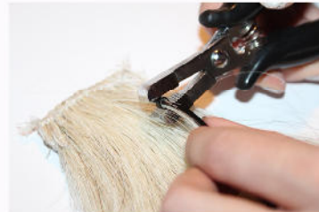
Microring mit der Zange zerdrücken