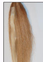
Extensions sind jetzt fest verbunden