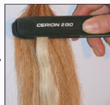
Extensions 4 Sekunden mit dem Glätteisen zusammen drücken