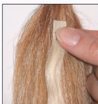
Extensions zusammen drücken